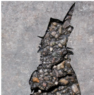
Matthias Gnatzy - Bilder & Objekte

StandHaft Aquagraphien aus St. Petersburg und Ludwigsburg.